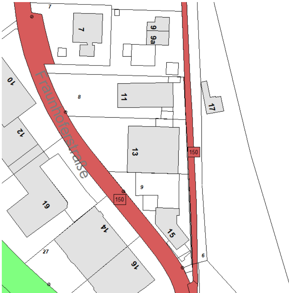
Bebauungsplan „Gewerbepark Bichler Straße vom 29.01.1999: